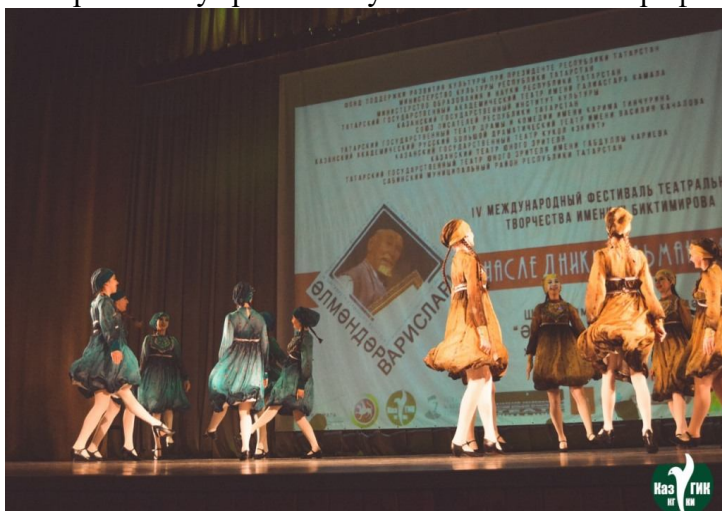
Фото 3. Сцена из спектакля участников фестиваля

За 2 конкурсных дня участники фестиваля показали спектакли, чтецкие и вокальные номера новому зрителю и услышали мнение профессионального жюри (фото 3).