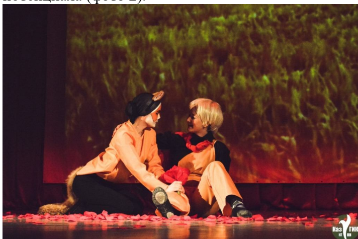
Фото 2. Сцена из спектакля участников фестиваля

Целью фестиваля является выявление и поддержка детских театральных коллективов, приобщение участников коллективов к театральному искусству, развитие их творческого потенциала (фото 2).