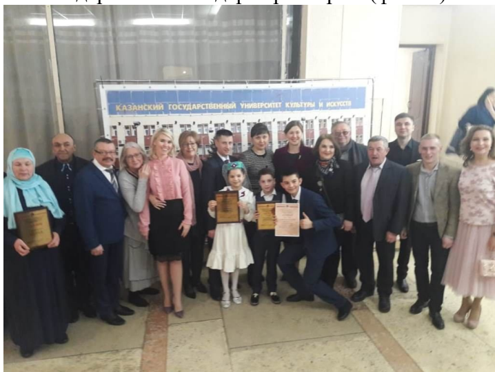
Фото 1. Организаторы и победители фестиваля

16, 17 февраля в Казанском государственном институте культуры прошел Международный фестиваль театрального творчества им.Ш.Биктемирова «Наследники Альмандара»- «Әлмәндәр варислары» (фото 1).