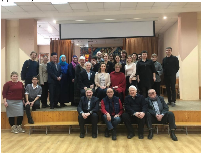
Фото 7. Организационная группа фестиваля

Отдельную благодарность Казанский государственный институт культуры за поддержку и существенный вклад в развитие фестиваля выражает Президенту РТ, Фонду поддержки развития культуры при президенте РТ, Министерству культуры РТ, Министерству образования и науки РТ, главе Сабинского муниципального района РТ, Союзу театральных деятелей РТ, Союзу писателей РТ, Театру эстрады «Салават», Татарскому государственному академическому театру имени Галиаскара Камала, Казанскому татарскому государственному театру юного зрителя им.Габдуллы Кариева, Казанскому академическому русскому большому драматическому театру им.Качалова, Казанскому государственному театру юного зрителя, Татарскому государственному театру кукол «Экият», Татарскому государственному театру драмы и комедии им.Карима Тинчурина (фото 7).