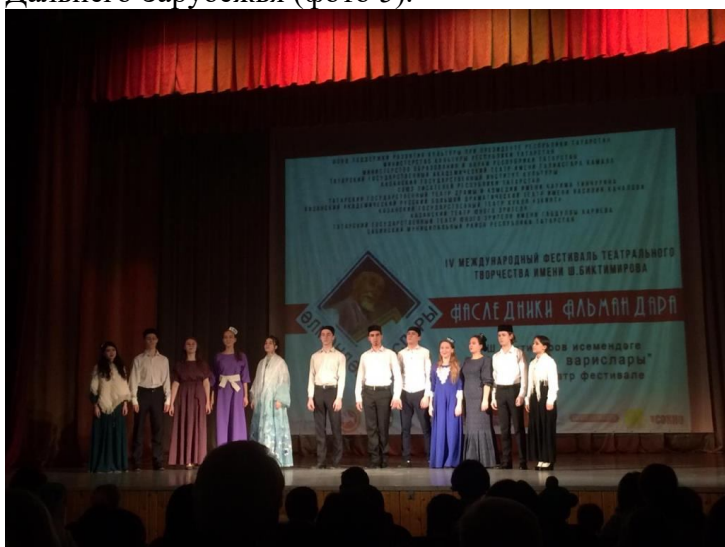
Фото 5. Участники фестиваля

Всего на фестиваль заявилось более 40 театральных коллективов, на очный этап прошли 17 лучших спектаклей. География конкурса впечатляет: представлены участники не только из Татарстана и России, но и из Тайланда, Гвинея-Бисау, Стран Ближнего и Дальнего Зарубежья (фото 5).