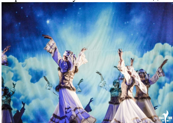
Фото 6. Сцена из спектакля участников фестиваля

Также, в фестивале приняли участие студенты из профильных СУЗов: Елабужский колледж культуры, Казанское театральное училище, Вятский колледж культуры, Марийский Республиканский колледж культуры и искусств им. И.С.Палантая (фото 6).