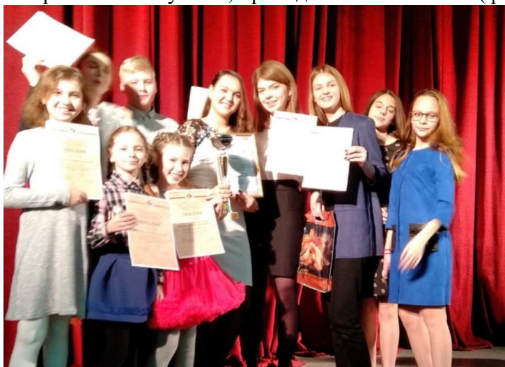
Фото 4. Награждение победителей фестиваля

На церемонии награждения были оглашены результаты фестиваля и награждены победители. Также, участники побывали на мастер-классах специалистов в области театрального искусства, преподавателей КазГИК (фото 4).